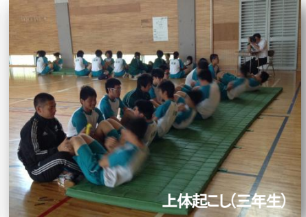
上体起こし(三年生)