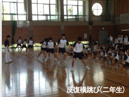
反復横跳び(二年生)