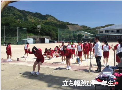
立ち幅跳び(一年生)