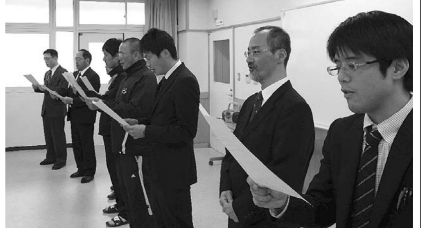
1学年の正副担任が校歌指導