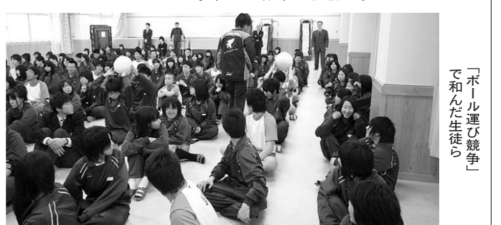
「ボール運び競争」で和んだ生徒ら

サッカー部は3年生の少ないチームと言えませんが、本サッカー部は少ない人数ながらも、一人ひとりの果たす役割、責任が大きく、責任が大きい。一人の選手が複数のポジションをこなす、協力し助け合っことで選手たちは自らの地位を確立していきます。選手の中にはサッカーの経験が短い選手や未経験の選手もいます。それでもサッカーを楽しみ一生懸命自分を伸ばそうと頑張っています。